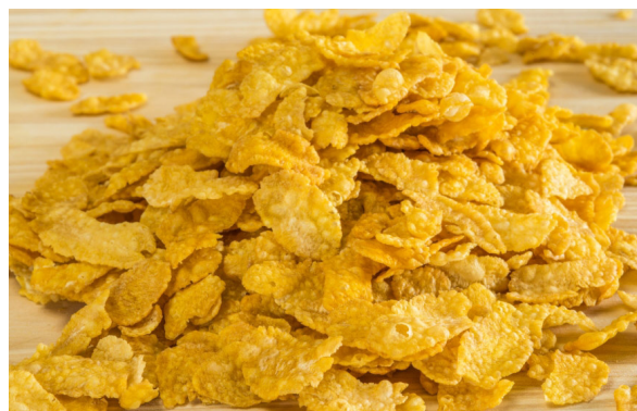
↑ Confezionamento dei Cereali