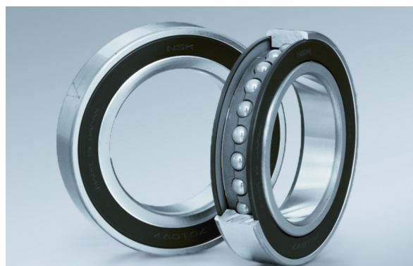
↑ Łożysko superprecyzyjne uszczelnione