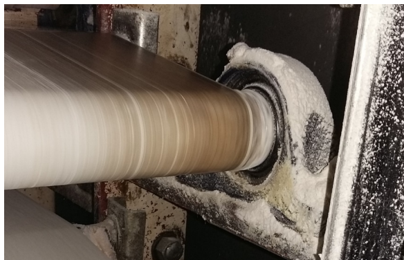
↑ Wyrastanie ciasta