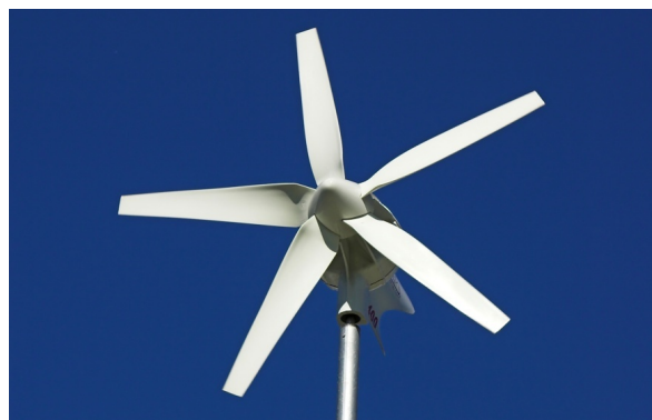
↑ Turbina wiatrowa