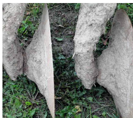
Immagine tipica di un erpice a dischi compatto coperto di sporcizia in seguito all'uso di fertilizzanti liquidi.