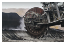
Industria de la Minería