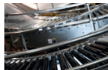
Manipulación de Materiales