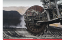
Taşocağı, Madencilik ve Yapı