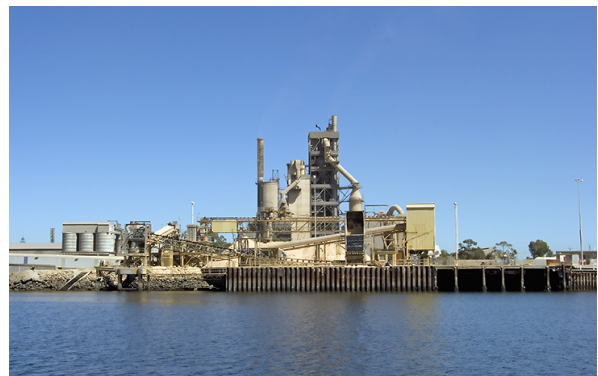
↑ Fabrique de Béton