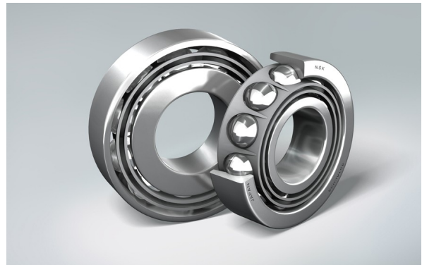
↑ Roulement à Billes à Contact Oblique en Acier Spécial HTF