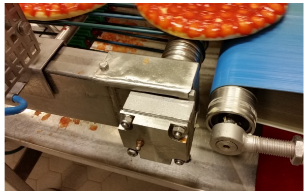
↑ Ligne de production de pizzas surgelées