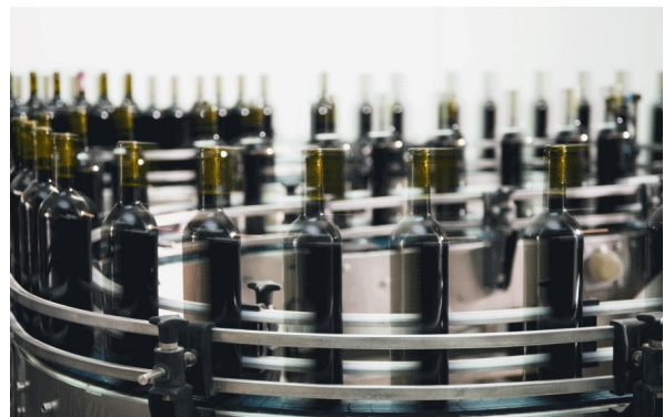
↑ Usine d'embouteillage