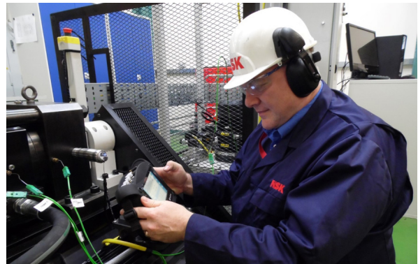
↑ Service d'Analyse Vibratoire (CMS)