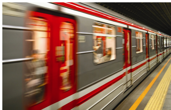
↑ Rames de métro