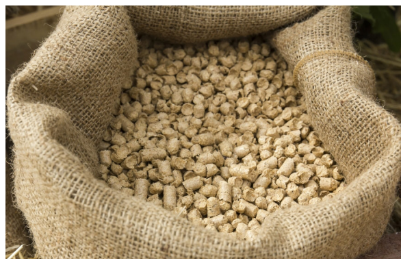
↑ Trasportatore di Alimentazione