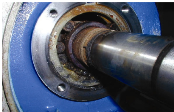
↑ Pompa odśrodkowa dla rafinerii