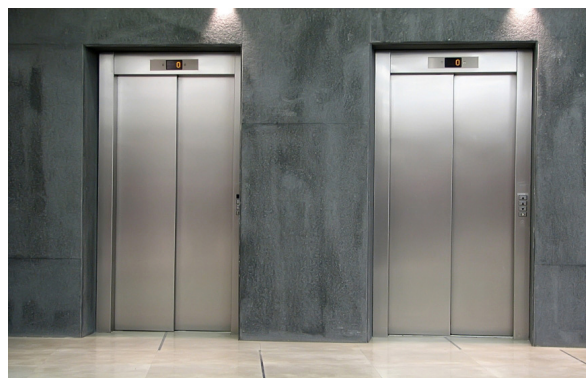
↑ Przekładnie do wind