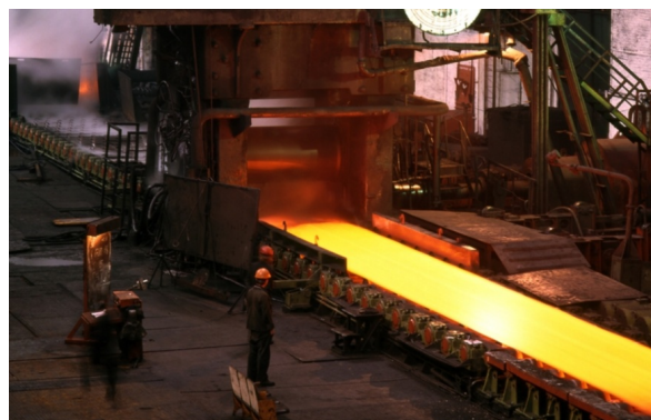
↑ Walcarka do blach grubych