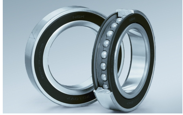
↑ Keçeli Eğik Bilyalı Rulmanlar